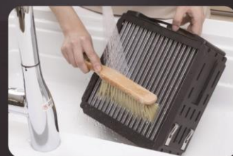
フィルター 水洗いOK

※10 【試験機関】北里環境科学センター【報告書番号】北生発2021_0680号【試験方法】日本電機工業会規格(JEM1467)の性能評価試験に基づき浮遊ウイルスの除去試験を実施。なお、風量はAirdog X3s、X5s「L4」モード、X8Pro「L5」モードで実施【試験対象】大腸菌ファージ MS2【試験結果】(X3s43分、X5s29分、X8Pro14分)で99.9%除去 ※11 China GB/T18801-2015 Air Cleaner規格により外部機関(Vkan Certification & Testing Co.,Ltd.)で試験して得られたCADR値に基づいた数値より算出。AHAM規格に基づく数値ではありません。畳数は1畳を1.54m 2 (江戸間換算)、部屋の高さを2.4mとして算出 ※12 米国特許:US9868123B2/US9735568B2